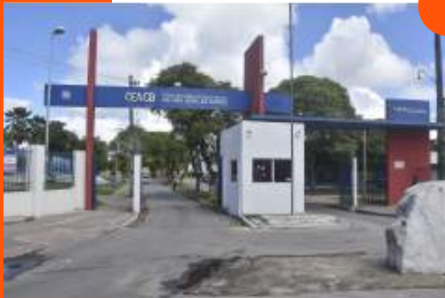
CEPA – Centro de Estudos e Pesquisa Aplicada – Farol

Os pontos de encontro da população serão os seguintes: