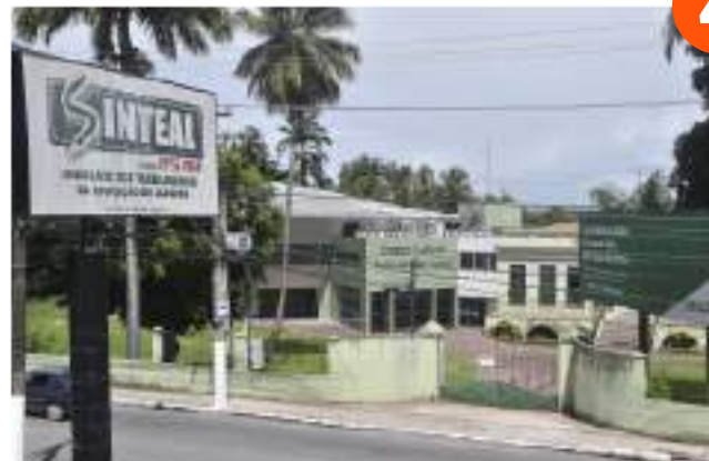
Sinteal – Sindicato dos Trabalhadores da Educação de Alagoas – Mutange;