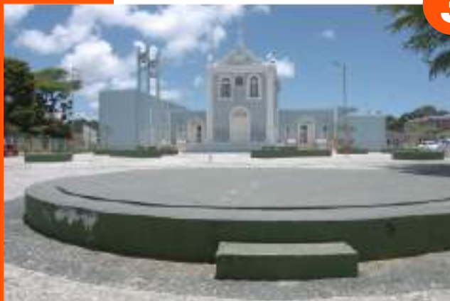
Praça Lucena Maranhão – Bebedouro;