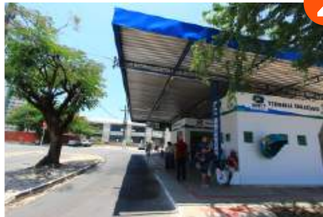
Praça Joaquim Marques Luz – Pinheiro;