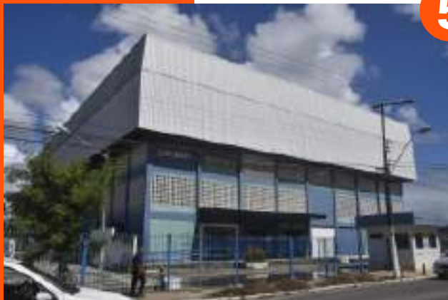
Ginásio Tenente Madalena – Bom Parto;

Os pontos de encontro serão usados apenas como locais de embarque da população nos ônibus com destino ao Ginásio do Sesi, local de abrigo provisório, até que a chuva passe e a avaliação técnica da estabilidade do terreno seja feita.